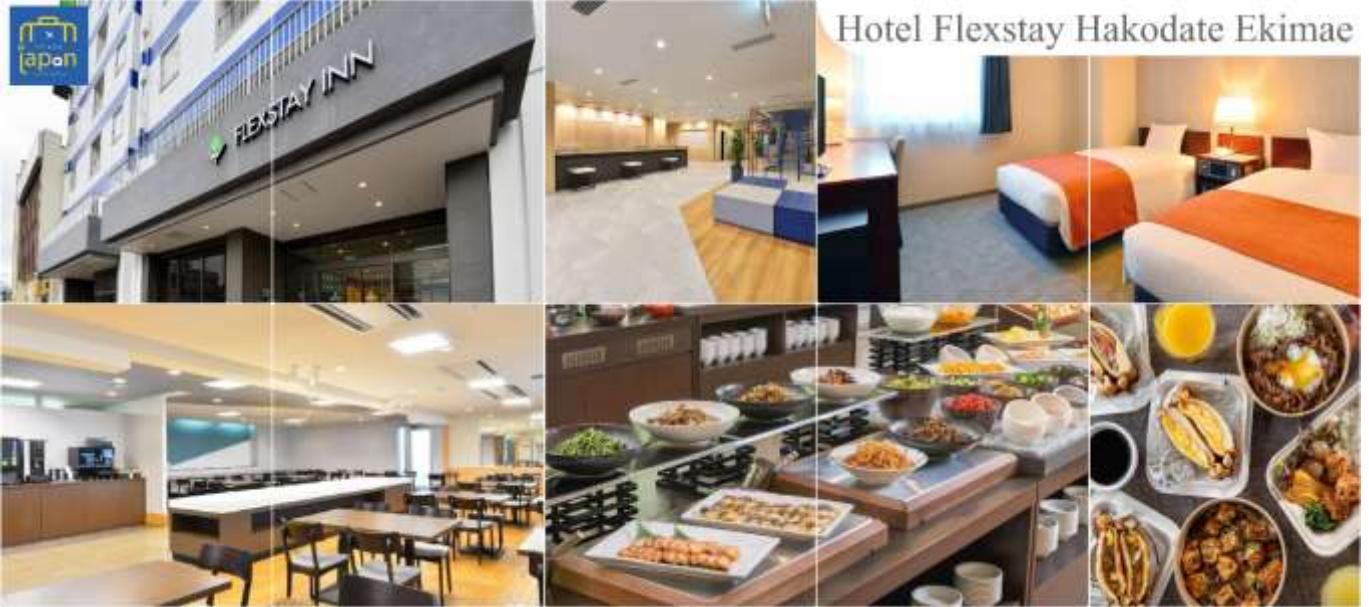
Hotel Flexstay Hakodate Ekimae

FLEX STAY INN HAKODATE EKIMAE หรือเทียบเท่าระดับเดียวกัน