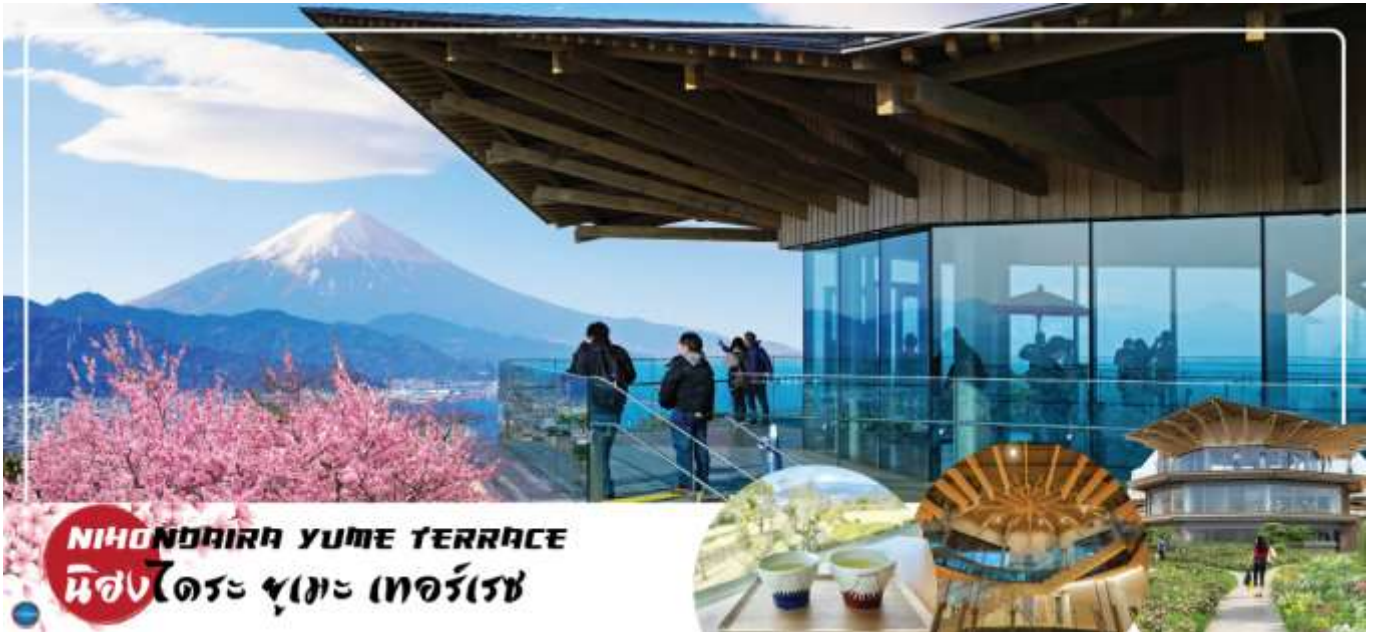
NIHONDAIRA YUME TERRACE นิฮงไดระ ยูเมะ เทอร์เรซ

ระหว่างระเบียบกับทางเดินไปยังที่จอดรถ นอกจากนี้ยังมีการจัดแสดงนิทรรศการ และคาเฟ่ สำหรับให้ท่านได้เพลิดเพลิน จิบนม ชิมกาแฟ สัมผัสบรรยากาศดีๆ กับวิวภูเขาไฟฟูจิตามอัธยาศัย