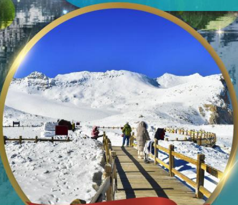
ต่ากู่กลาเซียร์