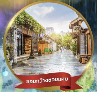
ชอยกว้างชอยแคบ