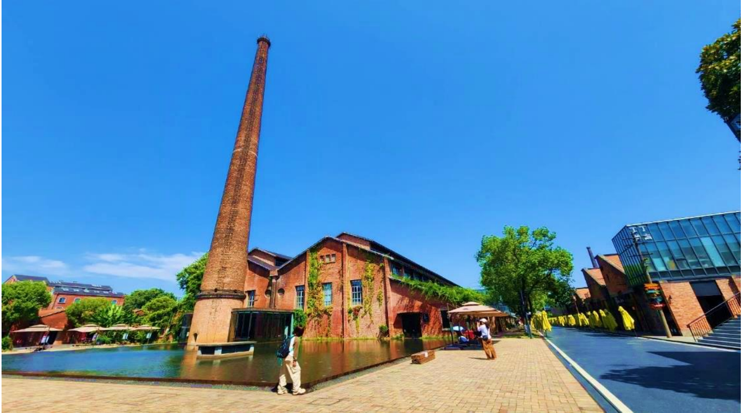
แวะซื้ออย่างเพลิดเพลินเลยทีเดียว