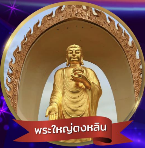
พระใหญ่ตงหลิน