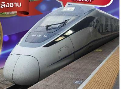
"รวมรถไฟความเร็วสูง เข้าจางซา"