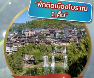
"พักติดเมืองโบราณ 1 คืน"