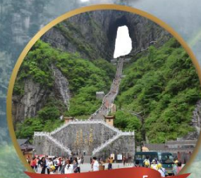
กำแพงสวรรค์