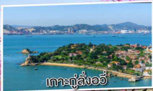
เกาะกู่ลิ่งอวี่