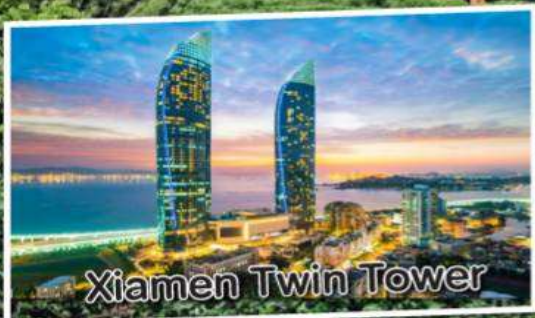
Xiamen Twin Tower