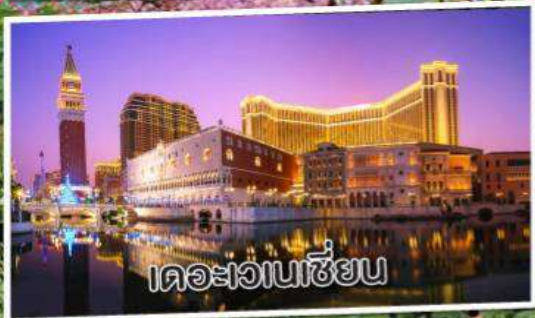
เดอะเวเนเซียน