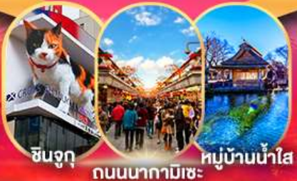
ชินจูกุ ถนนนากามิเซะ หมู่บ้านน้ำใส

วัดอาซากุสะ ถนนนากามิเซะ โตเกียว สกายทรี ไอโดมะ โตเวอร์ซิตี ล่องเรืออุทยานฮาโกเน่ ไอซีโฮ-ฮักโก เจคีย์ยูเรโต พิพิธภัณฑ์แผ่นดินไหว