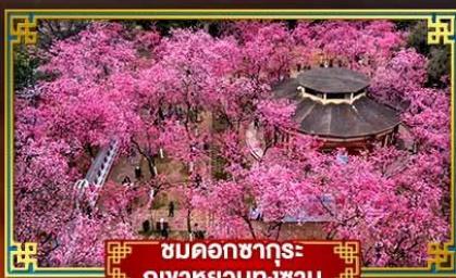
ชมดอกซากุระ ภูเขาหยวนทงซาน