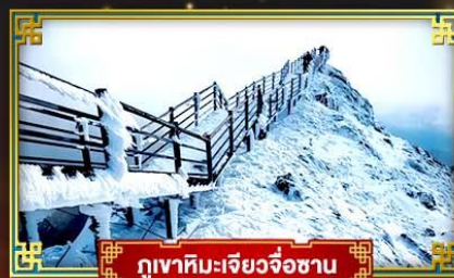
ภูเขาหิมะเจียวจื่อซาน