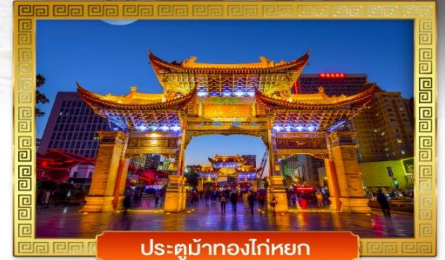
ประตูม้าทองโก๊ตหยก