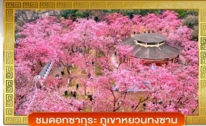
ชมดอกซากุระ ภูเขาหยวนทงซาน