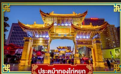
ประตูม้าทองโตหยก