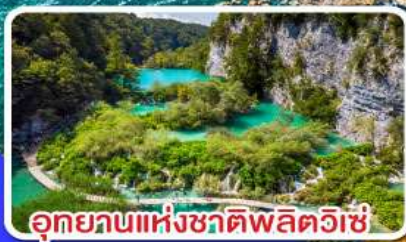
อุทยานแห่งชาติพลิตวิซ