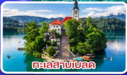
ทะเลสาบเบลด