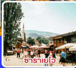
ซาดาร์โย