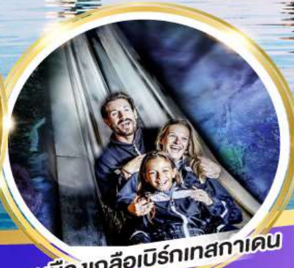
เหมืองเกลือเบิร์กเทศกาเดน