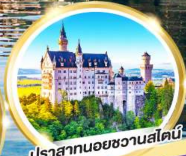
ปราสาทนอยชวานสไตน์