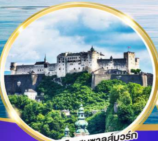
ปราสาทโฮเฮนชาลส์บวร์ก