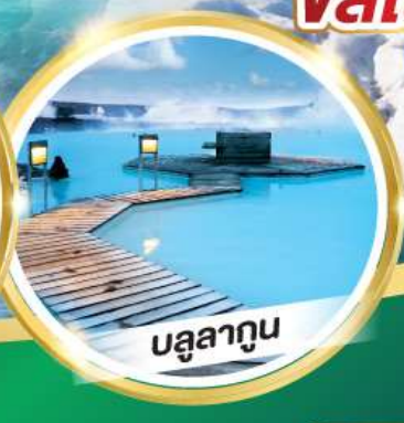
บรูสาทูน