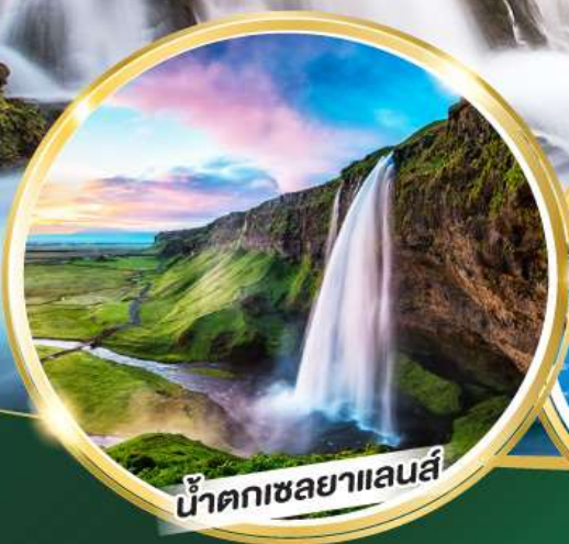
น้ำตกเซลยาแลนส์