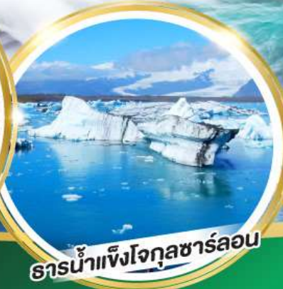
ธารน้ำแข็งโจกุลชาร์ลอน