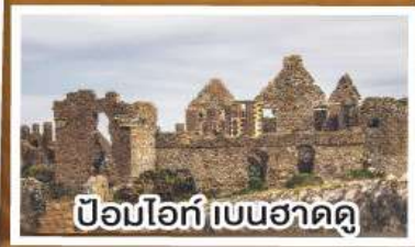
ป้อมโอท์ เบนฮาดีดู