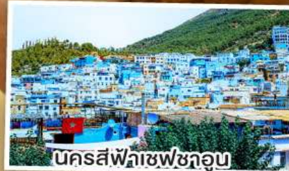
นครสีฟ้าเซฟซาอุน