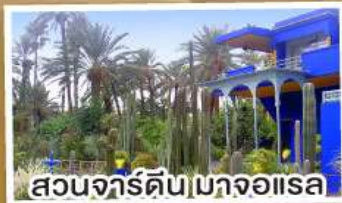
สวนจาร์ดิน มาจอแรล