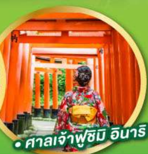
• ศาลเจ้าฟูชิมิ อินาริ