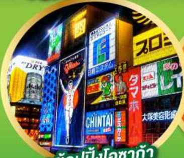
• ช้อปปิ้งโอซาก้า