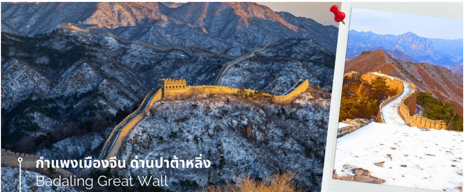
กำแพงเมืองจีน ด้านป่าต้าหลิ่ง Badaling Great Wall

จากนั้นนำท่านเดินทางชมความยิ่งใหญ่ของ กำแพงเมืองจีน ด้านป่าต้าหลิ่ง เป็นที่ตั้งของกำแพงเมืองจีนที่มีผู้เข้าชมมากที่สุด ห่างจากใจกลางเมืองปักกิ่งไปทางตะวันตกเฉียงเหนือประมาณ 80 กิโลเมตร ในเมืองป่าต้าหลิ่ง เขตหยานชิง เทศบาลนครปักกิ่ง ได้รับการอนุรักษ์อย่างดีที่สุดของกำแพงเมืองจีน นำท่านนั่งกระเช้าลอยฟ้า (รวมค่ากระเช้า) เพื่อ