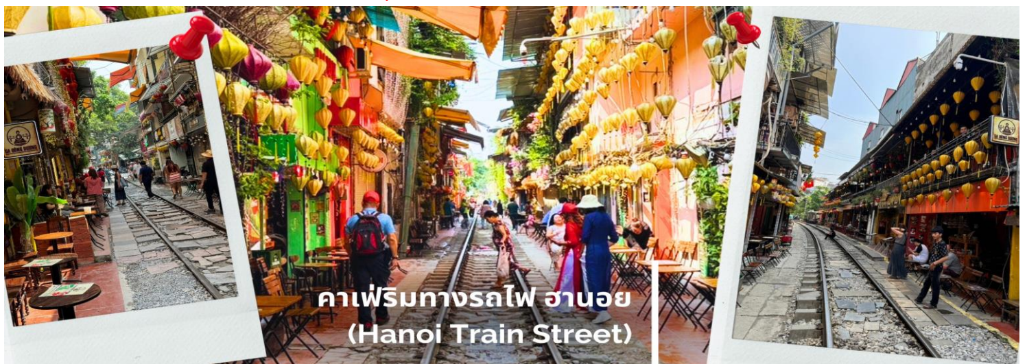
คาเฟ่ริมทางรถไฟ ฮานอย (Hanoi Train Street)