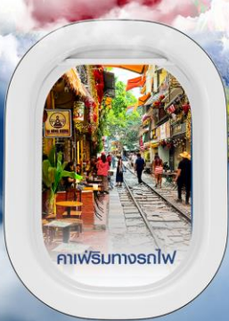
คาเฟ่ริมทางรถไฟ