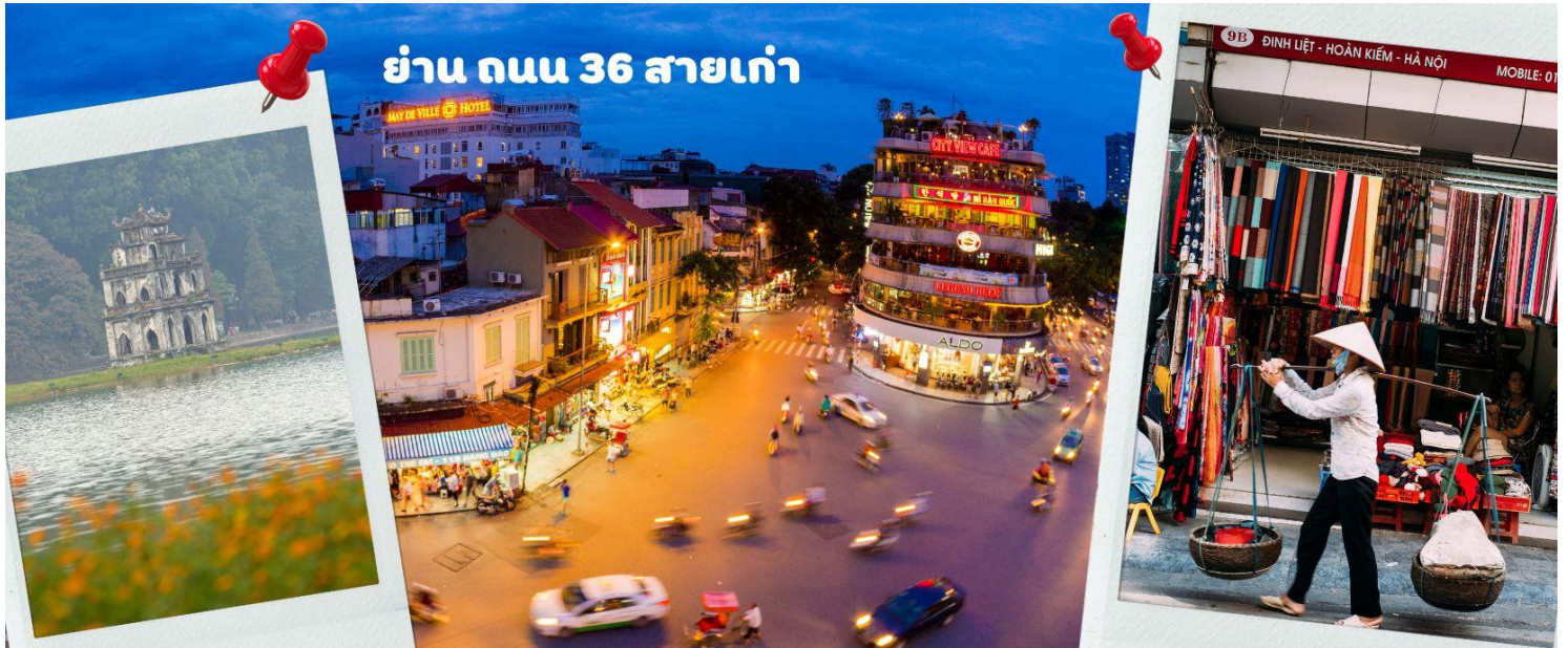
ย่าน ถนน 36 สายเก่า

แต่ละเส้น ในอดีตอย่าง เครื่องเงิน ผ้าไหม บนถนนแห่ง แต่ปัจจุบันมากกว่า 36 ไปแล้ว ที่นี้จะเป็นแหล่ง Shopping มีสินค้าเกือบทุกชนิด ร้านขายชุดกีฬาทุกแบรนด์เพราะที่นี่เป็นแหล่งผลิตให้หลาย ๆ แบรนด์