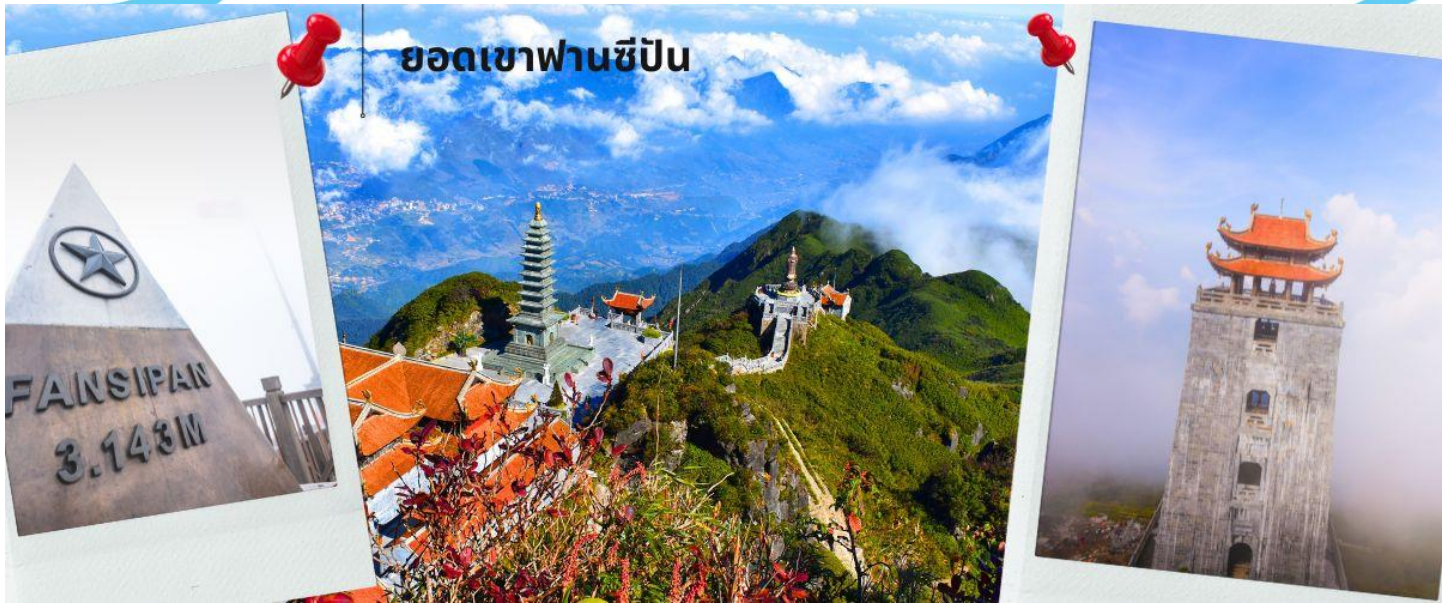
ยอดเขาฟานซีปัน