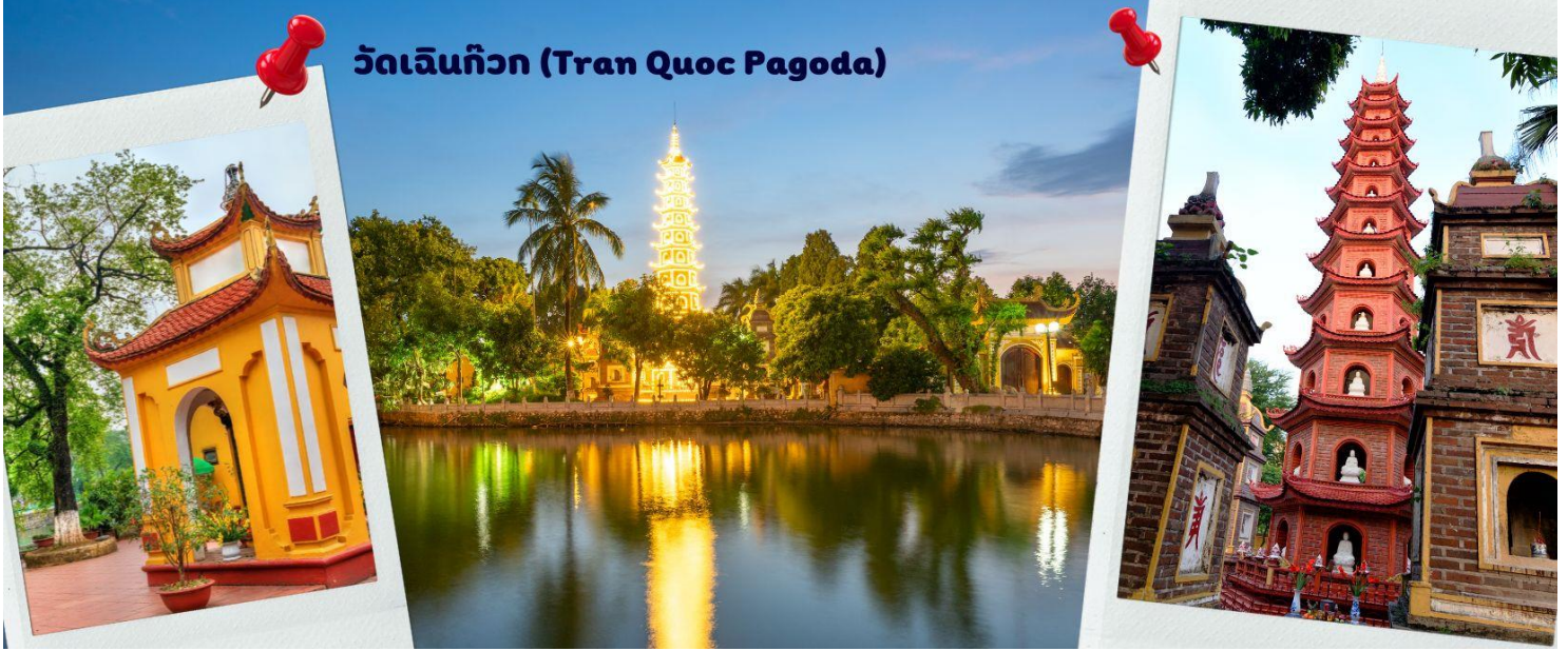
วัดเจ็นก๊วก (Tran Quoc Pagoda)

เส้นทางคมนาคมเข้าถึงที่ สิ่งปลูกสร้างมีการวางผังเป็นอย่างดี ใช้สีสันทันที่กลมกลืนในโทนสีเหลือง น้ำตาล ตัดกับสีเขียวของต้นไม้ใหญ่ที่โอบล้อมอยู่ ในมุมถ่ายภาพจากอีกฝั่งหนึ่ง จะเห็นสิ่งปลูกสร้างสไตล์จีน และเจดีย์หลายชั้นโดดเด่น มีภาพที่สะท้อนลงสู่ผืนน้ำ เป็นภูมิทัศน์ที่งดงามทั้งยามกลางวันและยามค่ำคืนที่มีการเปิดไฟส่องสว่าง