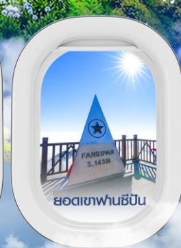
ยอดเขาฟานซิปัน

✈️ คอนเฟิร์ม ออกเดินทาง ✈️ ทุกพีเรียด 2 ท่านขึ้นไป