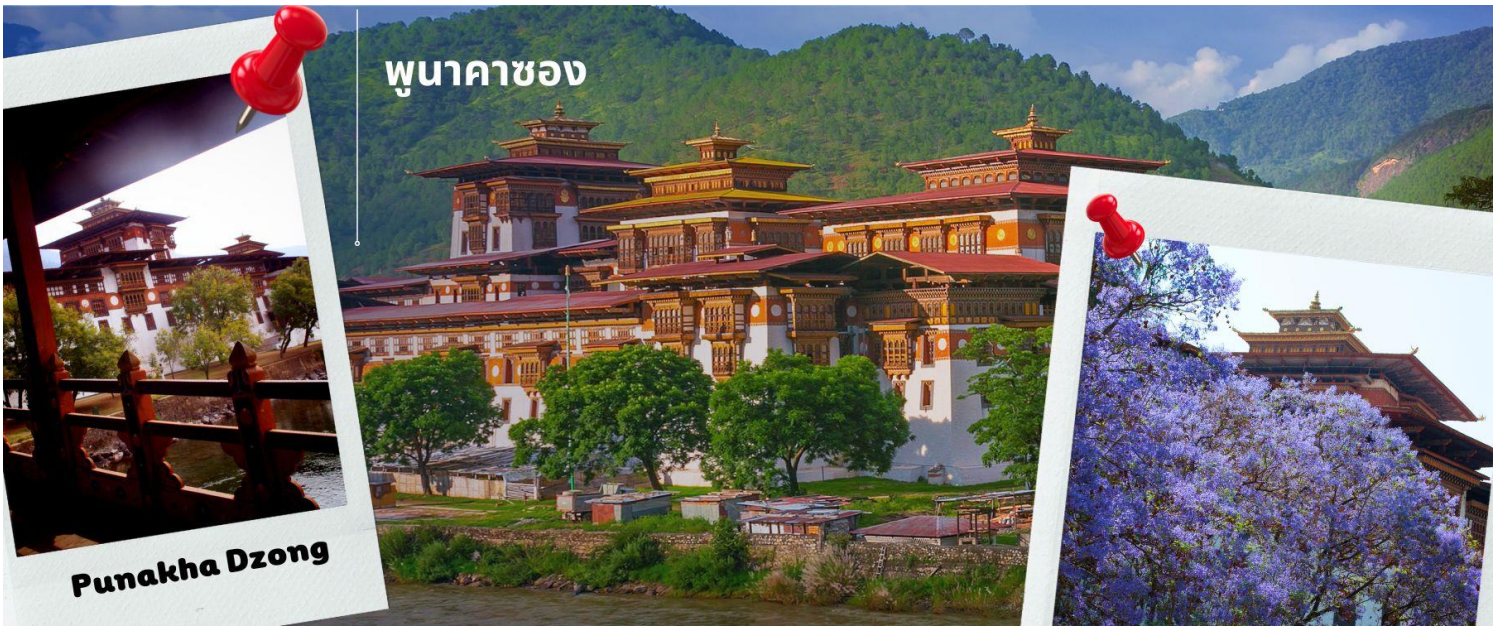
พุนาคาซอง