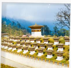
จุดชมวิวโดมธูล่า