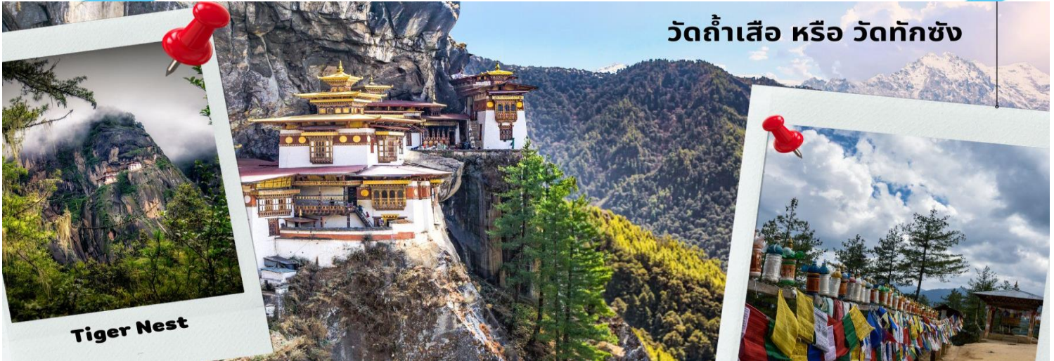
วัดถ้ำเสือ หรือ วัดก๊กซัง

เที่ยง รับประทานอาหารเที่ยง ณ ภัตตาคารด้านบนระหว่างทางขึ้นทักซัง (มื้อที่ 10) นำทุกท่านเดินเท้าลงจากเขา (ไม่สามารถอนุญาตให้นั่งม้าลงมาด้านล่างได้ เนื่องจาก อันตรายเป็นอย่างมากต่อตัวผู้เดินทาง) จากนั้นเดินทางต่อสู่ วัดคิซุ ลาคัง หนึ่งในวัดที่เก่าแก่ในประเทศภูฏาน สมัยศตวรรษที่ 7 วัดนี้เป็นวัดที่มีความเชื่อว่าสร้างไว้เพื่อตรึงเท้าซ้ายของนางยักษ์ตนหนึ่งที่นอนทอดร่างปิดทับประเทศทิเบตและเทือกเขาหิมาลัยไว้ จากนั้นเพลิดเพลินกับ การช้อปปิ้ง ณ พาโร สตรีท ชื้อของฝากของที่ระลึก ตามอัธยาศัย ค่ำ รับประทานอาหารค่ำ ณ ภัตตาคาร (กรณีเดินทาง 10 ท่านขึ้นไปพร้อมชม การแสดงท้องถิ่นของชาวภูฏาน) (มื้อที่ 11) นำทุกท่านเข้าสู่ที่พัก โรงแรม Metta Resort เมืองพาโร ระดับ 3 ดาว หรือเทียบเท่า