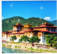
พูนาคาของ