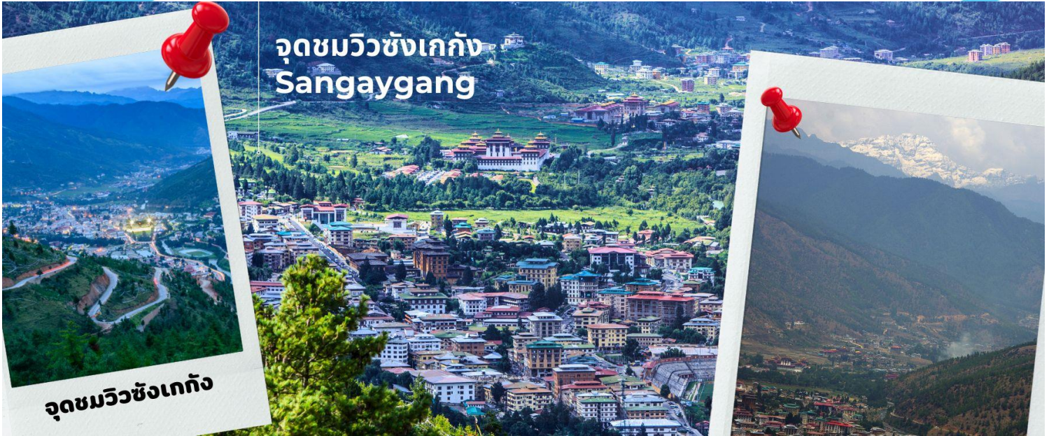
จุดชมวิวซังเกกัง Sangaygang