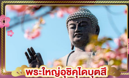
พระใหญ่อุซึคุโดบุตสึ