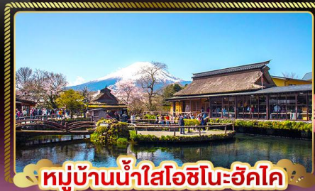
หมู่บ้านน้ำใสโอชิโนะฮักโค