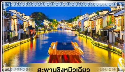
สะพานชิงหวิเวียดิว