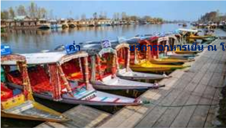
ค่า บริการอาหารเย็น ณ โรงแรม