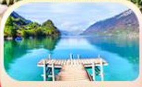
อิชลทวอลด์