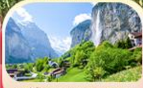
หมู่บ้านเลาเทอร์บรุนเนน