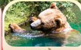
ป้อมหมีสีน้ำตาล