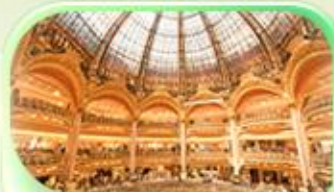
ซางลาฟาแยตต์