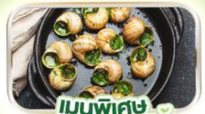
เมนูพิเศษ หอยเอสคาโก้

พิเศษ ล่องเรือแม่น้ำแซนชมเมือง โดย บาโต มูช