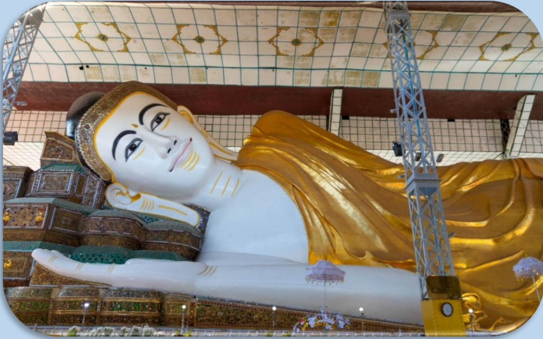
นำท่านชม เจดีย์ไจ้ปูน

( Kyaik Pun Pagoda ) สร้างในปี 1476 มีพระพุทธรูปปางประทับนั่งโดยรอบทั้ง 4 ทิศ สูง 30 เมตร ประกอบด้วย องค์สมเด็จพระสมณโคดมสัมมาสัมพุทธเจ้า (ผินพระพักตร์ไปทางทิศเหนือ กับพระพุทธรูปเจ้าในอดีต สามพระองค์คือ พระพุทธรูปเจ้ามหากัสสปะ ทิศตะวันตก) เล่ากันว่าสร้างขึ้นโดยสตรีสี่พี่น้องที่มีพุทธศรัทธาสูงส่งและต่างให้สัตย์สาบานว่าจะรักษาพรหมจรรย์ไว้ชั่วชีวิต