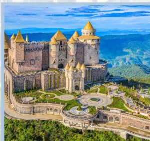
ปราสาทจันตรา