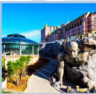
โซน Eclipse Square