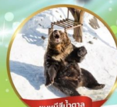
ชมหมีสึน้ำตาล