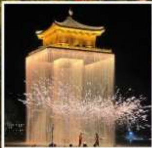
อู่ฉวีโจว