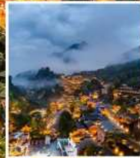
หุบเขาเทวดาวังเซียนกู่