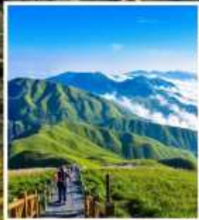
เขาอู่กงซาน