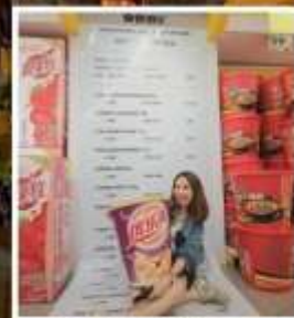
SNACK BUSY STATION