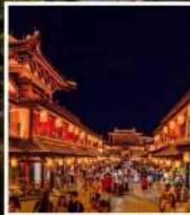
ถนนคนเดินว่านโซ่วกง