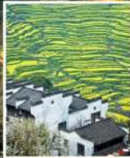
หมู่บ้านโบราณหวงหลิ่ง