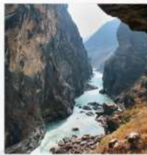
ช่องแคบเสือกระโดด