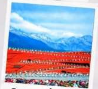
โชว์ อางอีโหมว