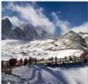
ภูเขาหิมะมังกรหยก