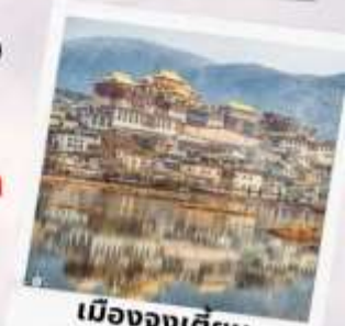
เมืองจงเตียน แยงกรีล่า