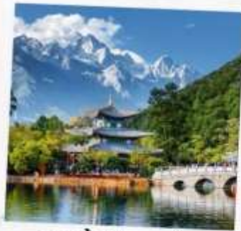
สระน้ำมังกรดำ