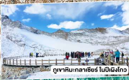
ภูเขาหิมะกลาเซียร์ ในปี่ผิงโกว