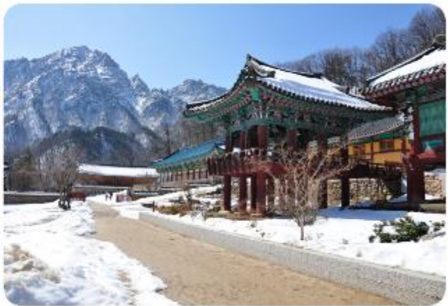
แห่งนี้ได้