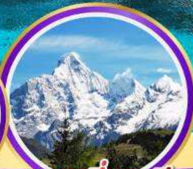
ภูเขาสี่ฤดู