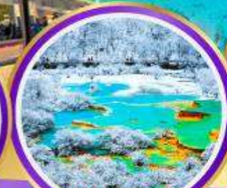
อุทยานหลวงหลง