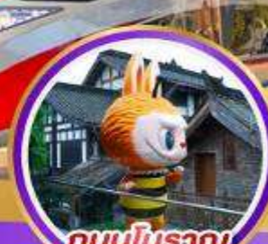
ถนนโบราณ ชอยกวางชอยแคบ