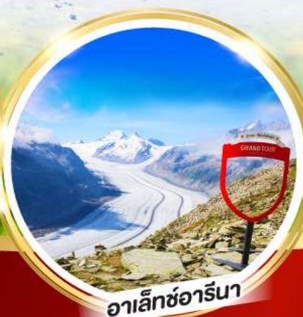
อาเล็กซารีนา