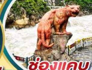
ช่องแคบ เสือกระโจน