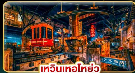
เทวินเทอโฮ่ย