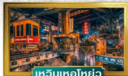
เหวินเหอหยั่ว