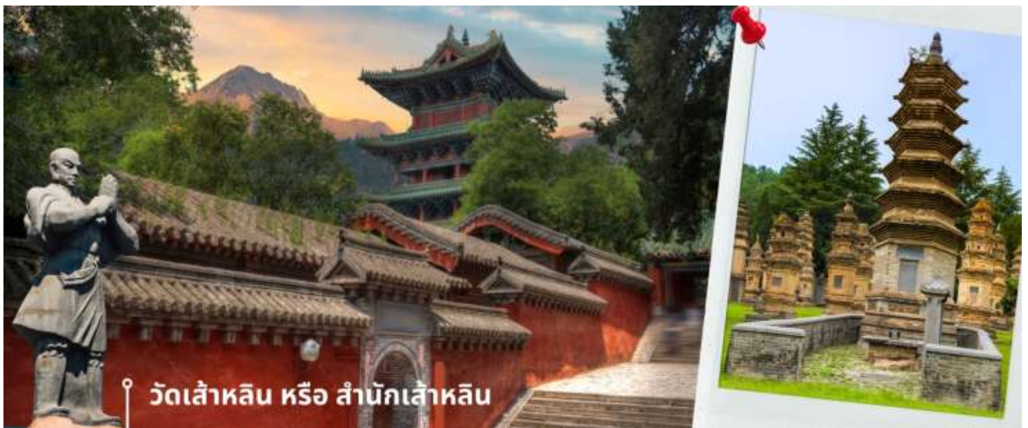
📍 วัดเส้าหลิน หรือ สำนักเส้าหลิน

นำท่านชม ป่าเจดีย์ หรือ ถ้ำหลิน ซึ่งมีอยู่ราว 230 ที่มีความเก่าแก่ เป็นสถานที่ศักดิ์สิทธิ์ที่ตั้งอยู่ภายในบริเวณวัด ซึ่งเป็น