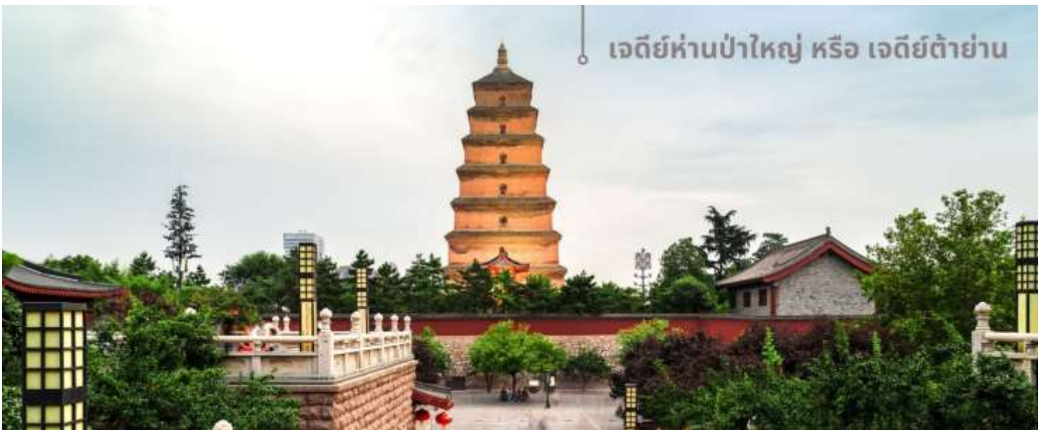
เจดีย์ห่านป่าใหญ่ หรือ เจดีย์ตั๋ย่าน

จากนั้นนำท่านเที่ยวชม เจดีย์ห่านป่าใหญ่ หรือ เจดีย์ตั๋ย่าน สถานที่ท่องเที่ยวระดับ 4A อายุมากกว่า 1,300 ปี ตั้งอยู่ในบริเวณวัดต้าฉือเอิน ซึ่งเป็นวัดสำคัญที่พระถังซำจั๋งเคยพำนัก ในตอนใต้ของเมืองซีอาน มณฑลส่านซี ตัวเจดีย์สร้างขึ้นใน