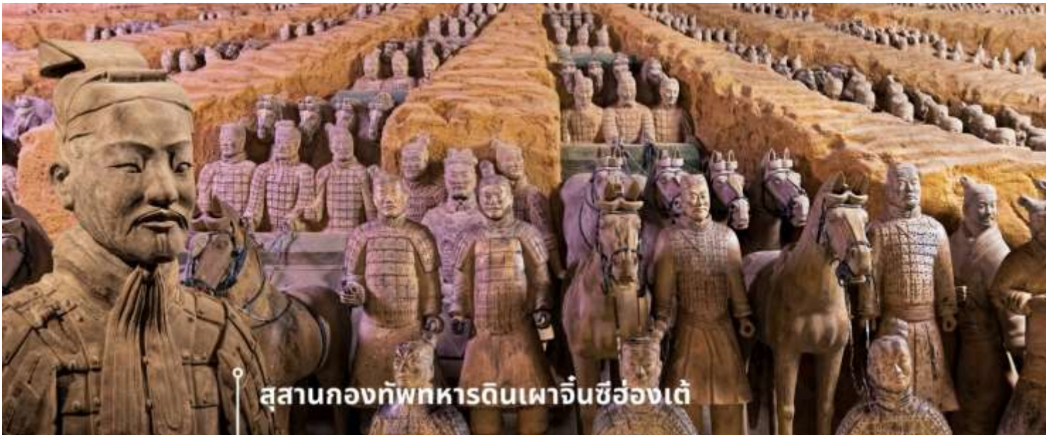
สุสานกองทัพทหารดินเผาจีนซีฮ่องเต้

คัมภีร์พระองคืในโลกหน้า สุสานและกองทัพทหารดินเผาที่จึงเปรียบเสมือนการสะท้อนอำนาจของพระองคืในยุคที่ยังมีชีวิต รวมถึงเป็นสัญลักษณ์แห่งความทะเยอทะยานของพระองคืที่ไม่สิ้นสุดแม้ในความตาย สุสานกองทัพทหารดินเผาถูกค้นพบในปี ค.ศ. 1974 โดยชาวนาที่ขุดบ่อน้ำในเขตซีอาน มณฑลส่านซี หลังการค้นพบครั้งนั้น การขุดค้นและวิจัยทางโบราณคดีก็เริ่มต้นขึ้น ซึ่งทั้งหมดถูกจัดเรียงอย่างเป็นระเบียบในพื้นที่สุสานขนาดใหญ่ ภายในใช้เป็นสถานที่บรรจุพระบรมศพจีนซีฮ่องเต้ รวมไปถึงกองทัพทหารดินเผามีจำนวนมากกว่า 8,000 ตัว แต่ละตัวมีขนาดเท่าคนจริง และยังมีม้าดินเผาอีกกว่า 600 ตัว พร้อมรถม้า และอาวุธต่าง ๆ ความน่าทึ่งอีกอย่างก็คือ ทหารดินเผาแต่ละตัวถูกปั้นขึ้นด้วยมือและมีรายละเอียดแตกต่างกันไป เช่น สีหน้า ทรงผม และเครื่องแต่งกาย ซึ่งสะท้อนยศและบทบาทของแต่ละคนในกองทัพ รวมถึงการเคลือบสีเพื่อให้รูปปั้นคงทนยาวนาน ซึ่งในปัจจุบัน สุสานแห่งนี้มีขนาดใหญ่ พื้นที่มากกว่า 56 ตารางกิโลเมตร ยังมีหลุมฝังศพหลัก และหลุมย่อยอีกมากมายที่ยังไม่ได้ถูกขุดค้น