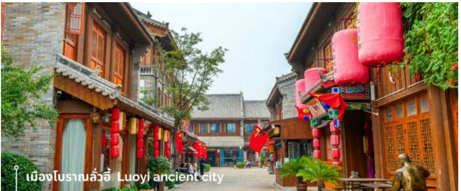
เมืองโบราณลั่วอี้ Luoyi ancient city

นำท่านเที่ยวชม เมืองโบราณลั่วอี้ เป็นสถานที่ท่องเที่ยวระดับ 1A ตั้งอยู่ในเมืองเก่าของเมืองลั่วหยาง เมืองหลวงโบราณของราชวงศ์ทั้ง 13 ราชวงศ์ บรรยากาศคอบอลไปด้วยเสน่ห์แบบจีนโบราณ ที่ยังคงอยู่มายาวนานหลายร้อยปี เมื่อเดินเล่นผ่านเมืองโบราณลั่วอี้ จะเห็นสถาปัตยกรรมบ้านเรือน ที่มีชายคาซ้อนกันเป็นชั้นๆ และกำแพงเมือง สนามหญ้า