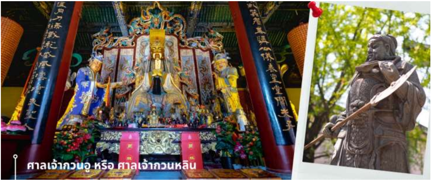
ศาลเจ้ากวนอู หรือ ศาลเจ้ากวนหลิน

นำท่านเที่ยวชม เมืองโบราณลั่วอี้ เป็นสถานที่ท่องเที่ยวระดับ 1A ตั้งอยู่ในเมืองเก่าของเมืองลั่วหยาง เมืองหลวงโบราณของราชวงศ์ทั้ง 13 ราชวงศ์ บรรยากาศคอบอลไปด้วยเสน่ห์แบบจีนโบราณ ที่ยังคงอยู่มายาวนานหลายร้อยปี เมื่อเดินเล่นผ่านเมืองโบราณลั่วอี้ จะเห็นสถาปัตยกรรมบ้านเรือน ที่มีชายคาซ้อนกันเป็นชั้นๆ และกำแพงเมือง สนามหญ้า