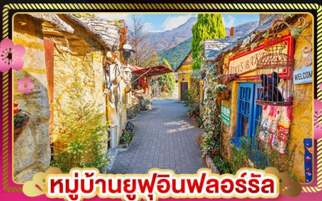
หมู่บ้านยูฟุอินฟลอริส