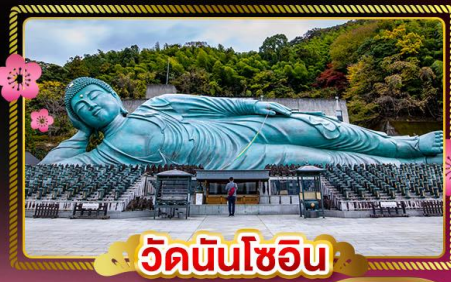
วัดนินโซอิน