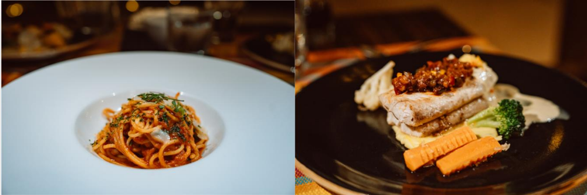
เสิร์ฟอาหารแบบ Fine Dining 3-4 Course