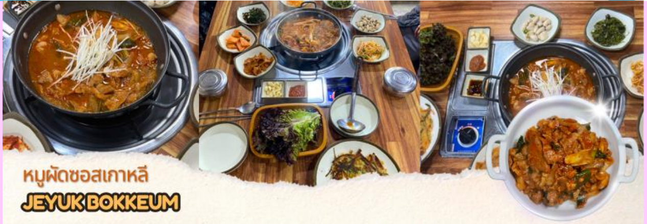
หมูผัดซอสเกาหลี JEYUK BOKKEUM