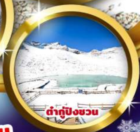
ตำกู่ปิงชว่น