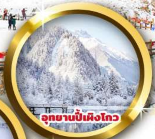
อุทยานปี้เฟิงโกว