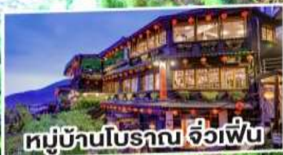
หมู่บ้านโบราณ จิวเฟิ่น