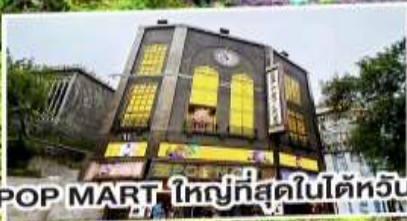
POP MART ใหญ่ที่สุดไต้หวัน