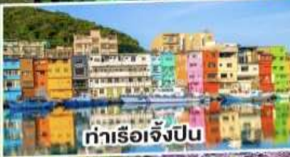
ท่าเรือเจิ้งปิ่น