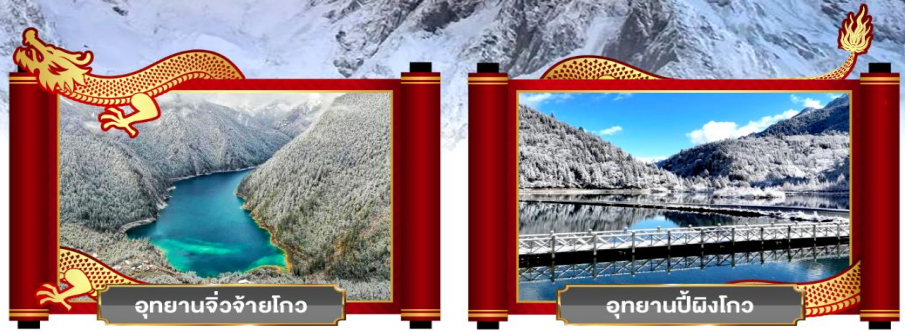
อุทยานจิวจ้ายโกว