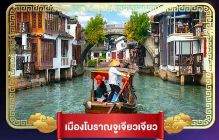
เมืองโบราณซูโจวเจียว