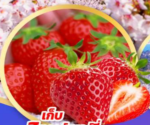
เก็บ สตอว์เบอร์รี่