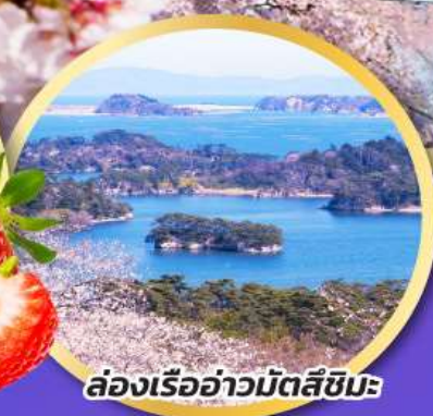
ล่องเรืออ่าวมัตสึชิมะ