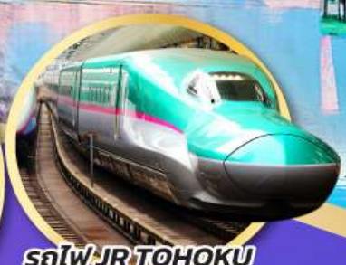
รถไฟ JR TOHOKU SHINKANSEN