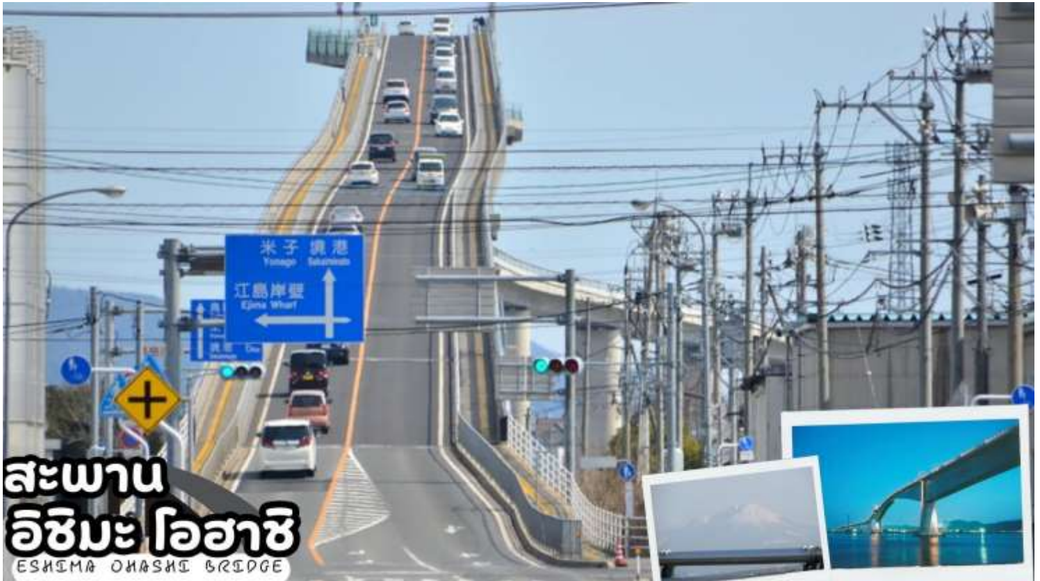
สะพาน อิชิมาะ โอฮาชิ ESHIMA OHASHI BRIDGE

ผ่านชม สะพานอิชิมาะ โอฮาชิ ( Eshima Ohashi Bridge ) สะพานสุดชันแห่งประเทศญี่ปุ่น ซึ่งเป็นเส้นทางเชื่อมต่อระหว่างจังหวัดชิมาเนะ และจังหวัดทตโตริ สร้างขึ้นเมื่อปีค.ศ. 2004 มีความยาว 1.7 กิโลเมตร เมื่อมองจากฝั่งชิมาเนะ สะพานแห่งนี้จะดูสูงชันมากจนไม่น่าจะเป็นไปได้ แต่ตามจริงแล้ว สะพานฝั่งชิมาเนะมีความชันเพียง 6.1% ส่วนฝั่งทตโตริมีความชันอยู่ที่ 5.1% เท่านั้น สะพานแห่งนี้เป็นสะพานโค้งข้อแฉ่งที่ใหญ่ที่สุดในญี่ปุ่น และใหญ่ที่สุดเป็นอันดับสามของโลก