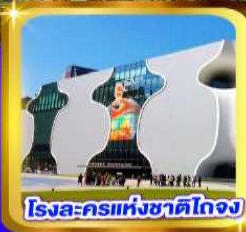
โรงละครแห่งชาติไถจง