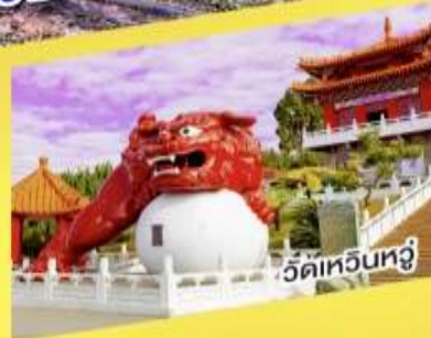
วัดหัวหนู