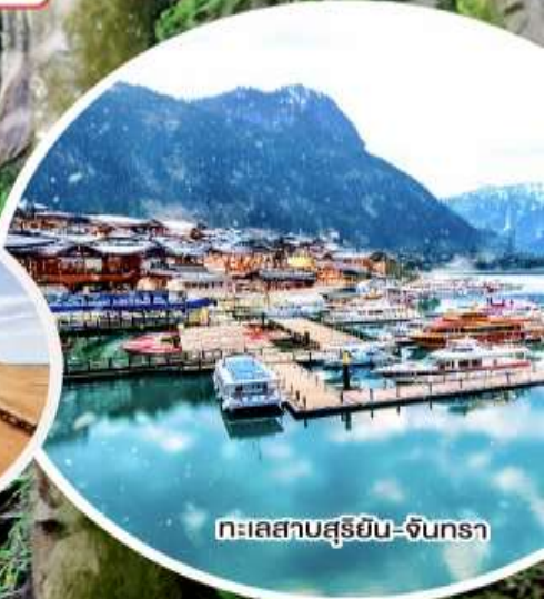
ทะเลสาบสุริยัน-จันตรา