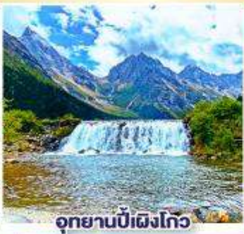
อุทยานปี้เผิงโกว