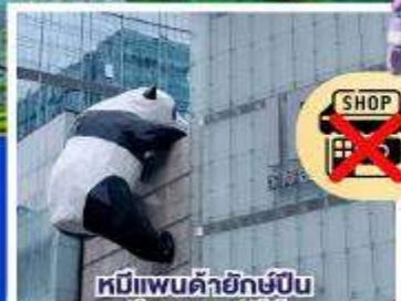
หมีแพนด้ายักษ์ปิ่น คิงกอนชุนซีอู่