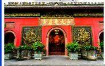
วัดต้าเจี๊ว