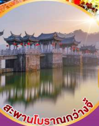
สะพานโบราณกว้างจิ๋ว