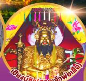
เมืองบูชิว (ศาลเจ้าพ่อเสือ)

เมนูพิเศษ!! อาหารแต่จิว 18 อย่าง ห้ามพลาดลิ้มตำรับชิวเกา สุกี้ซีฟู้ด