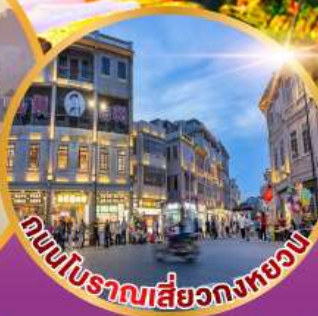
ถนนโบราณสี่แยกทองหย่น