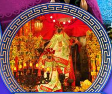
เจ้าแม่กวนอิมฮ่องกง