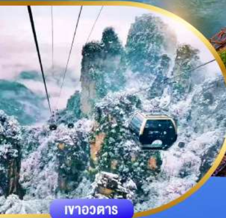
เทวอวตาร