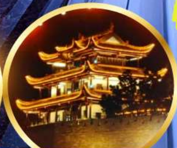
หอคอยทองคำเทียนซิน