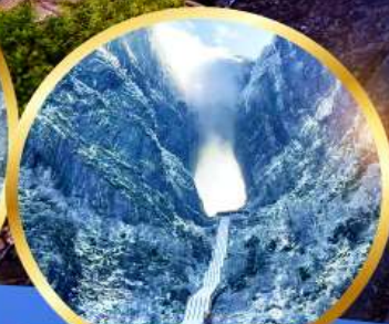
ประตูละออกร์ เทียมเหมินซาน