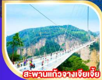
สะพานแก้วจากเจียเจีย