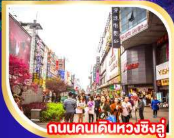
ถนนคนเดินหวงซิงอู่